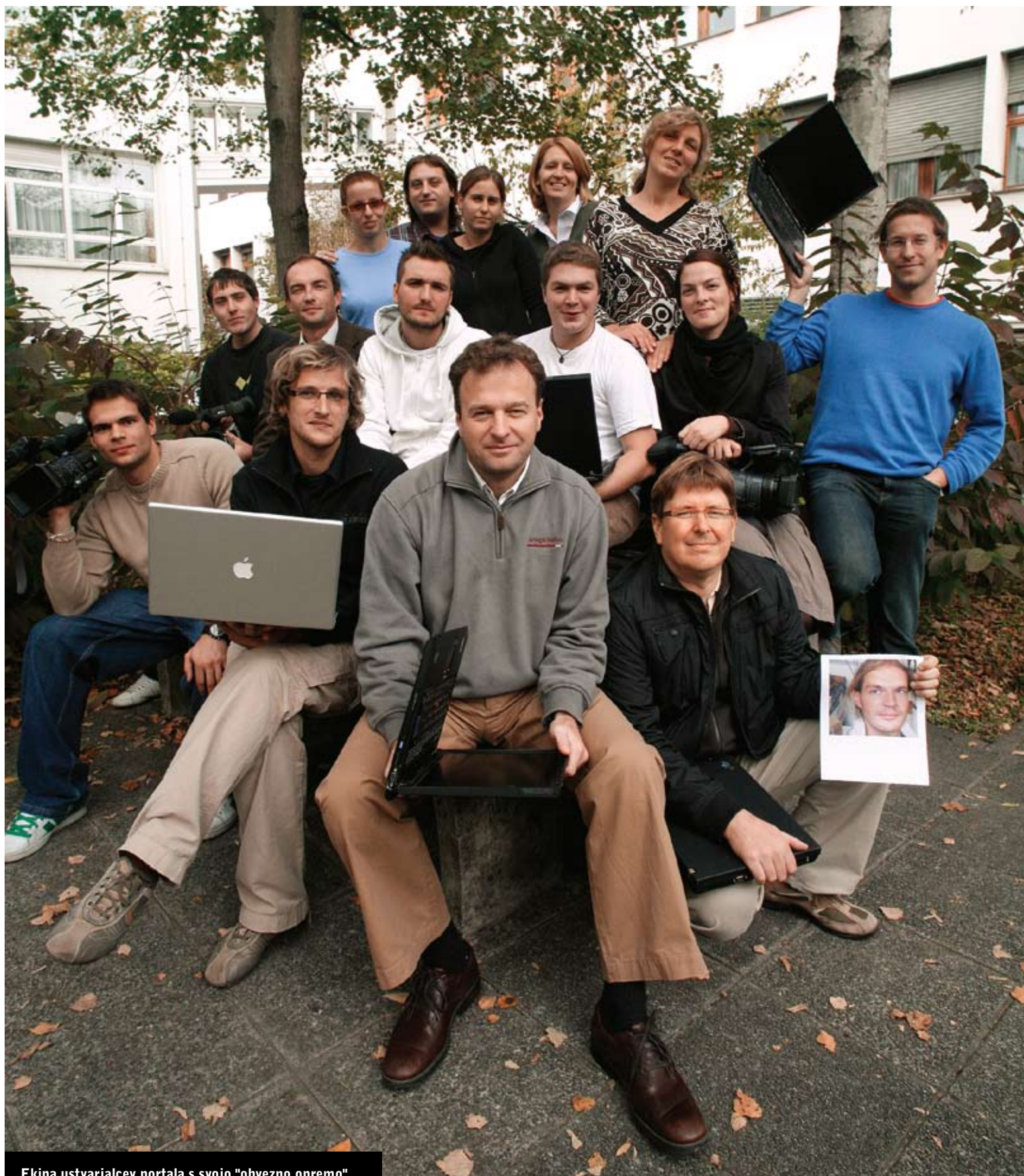
Ekipa ustvarjalcev portala s svojo "obvezno opremo"

esor odpovedal predavanja in študentom naročil, naj si ogledajo neko predavanje na portalu. Profesorji na novo odkrivajo čut za samokritičnost. »Zgodi se, da predavatelji gledajo svoje predavanje in si rečejo: 'Kako zanič predavam, moram se popraviti. Predavam staro šaro.' Opazili